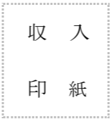
*印紙税額は裏面参照

甲、乙、丙を記入し、下記契約区分のいずれか一つ該当するものを○で囲み、甲と乙、甲と丙若しくは甲、乙及び丙の契約当事者のみ押印する二者契約書である。ただし「収集運搬及び処分用」は乙と丙が同一である場合に限る。