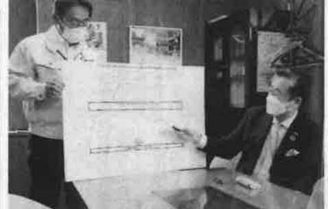
武藤社長はSRPによる環境DXの構築について説明した

環境DXとは、SRP(ソーラーパネル)による環境DXの構築について説明した。武藤社長はSRPによる環境DXの構築について説明した。